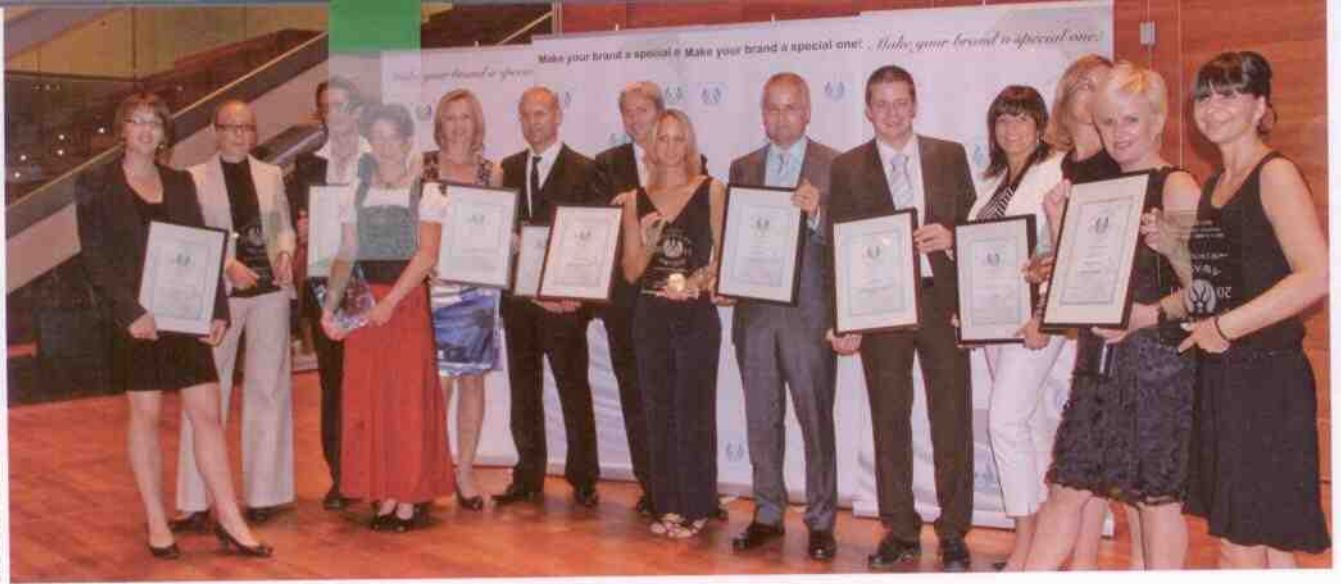
Einige der strahlenden Sieger (v. l. n. r.): aquabasilea, Hotel ... liebes Rot-Flüh, Schick Medical, Lefay Resort & SPA, Dr. Spiller, HUBERTUS Alpin, proSPA, haare & mehr.