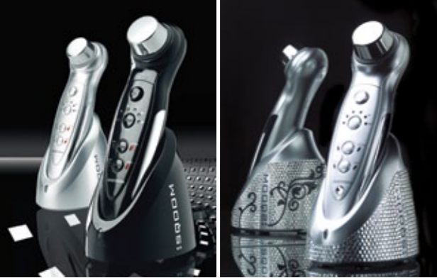
SQOOM BASIC plata/negro